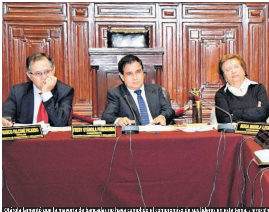
Otárola lamentó que la mayoría de bancadas no haya cumplido el compromiso de sus líderes en este tema.

Comisión del Congreso decidió ayer por mayoría no votar este asunto. Legisladores de Perú Posible, Fuerza Popular y el Apra se mostraron en contra de suprimir el mecanismo. Ollanta Humala criticó la decisión.