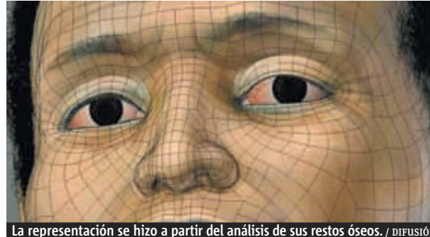
La representación se hizo a partir del análisis de sus restos óseos.

El equipo brasileño participó antes en la reconstrucción facial de santos como Santa María Magdalena de Pazzi y San Antonio de Padua. PUBLIMETRO