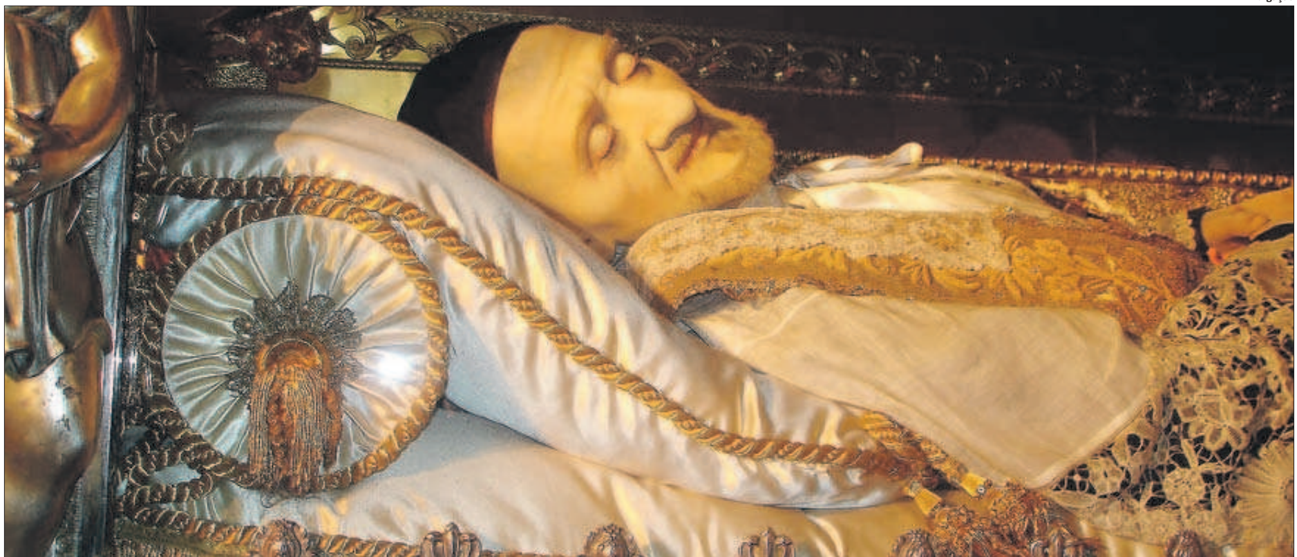
Réplica de cera que está no túmulo do santo patrono das obras de caridade, na Igreja de São Lázaro, em Paris: trabalho do CTI de Campinas vai mostrar se reprodução é fiel à realidade

As imagens recebidas foram transferidas para o computador e os registros passaram a ser cruzados graças a